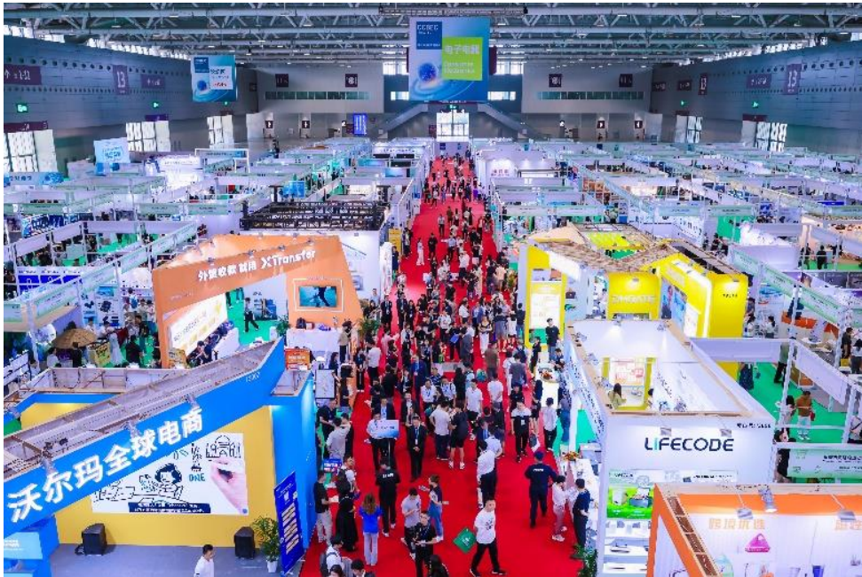
2024 年 CCBEC 展会上观众在电子电器馆内采购各种产品

深圳，2024 年 9 月 27 日。深圳跨境电商展览会（CCBEC）于 9 月 11 至 13 日在深圳国际会展中心成功举办，历时三天的展会现场人潮涌动，气氛热烈。本届展会面积达到 8 万平方米，吸引了国内外近 1,500 家参展商，分别来自中国、中国香港、巴西、丹麦、匈牙利、意大利、法国及英国等多个国家及地区。本次展会的国际化程度显著提升，吸引了多家海外平台和服务商的加入，进一步扩大了展会的影响力。观众达到 71,328 人次，较去年增长 25%。作为专业的跨境电商展会，CCBEC 吸引了众多行业专家、本地和国际优质供应商、平台、服务供应商以及卖家的参与，确保了展示产品的高质量和同期活动的专业水准。展会已成为行业未来趋势的风向标，引领着整个行业的发展方向，为业界提供了一个了解未来发展走向的重要参考。